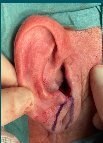
W trakcie zabiegu