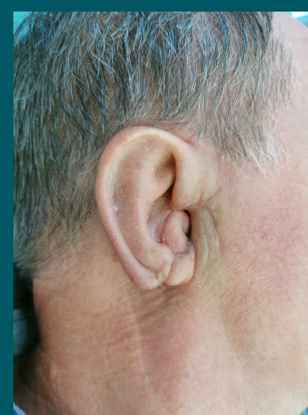
30 dni po zabiegu