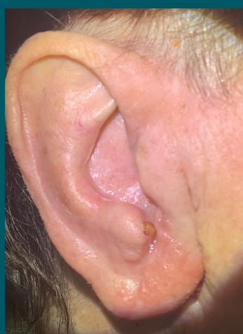
14 dni po zabiegu