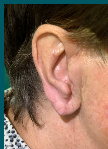
30 dni po zabiegu